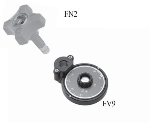
Förinställning antal varv från stängd ventil Tryckfallsdiagram